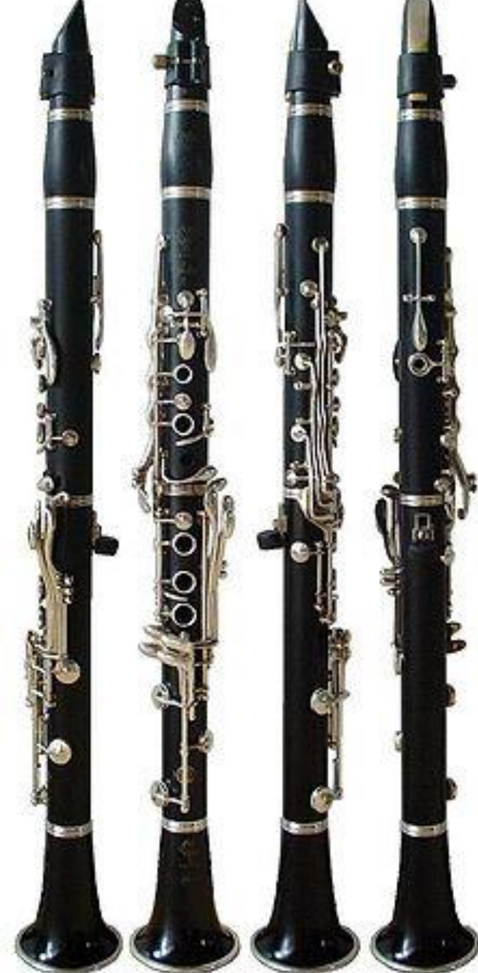
Clarinette Si b