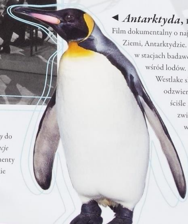
▲ Antarktyda , 1991, Nigel Westlake Film dokumentalny o najzimniejszym kontynencie Ziemi, Antarktydzie. Ludzie pracują tam w stacjach badawczych, pingwiny i foki żyją wśród lodów. Australijczyk Nigel Westlake skomponował muzykę odzwierciedlającą krajobraz i tak ściśle nawiązującą do ruchów zwierząt, że czasem powstaje wrażenie, jakby tańczyły w jej takt.