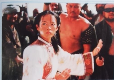
▲ Przyczajony tygrys, ukryty smok , 2000, Tan Dun Ścieżka dźwiękowa do tego magicznego filmu walki jest mieszanką stylów muzycznych Wschodu i Zachodu. Instrumenty azjatyckie, pop i wiolonczelowe solówki Yo-Yo Ma współdziałają, by odzwierciedlać starochiński klimat i emocje poszczególnych postaci.