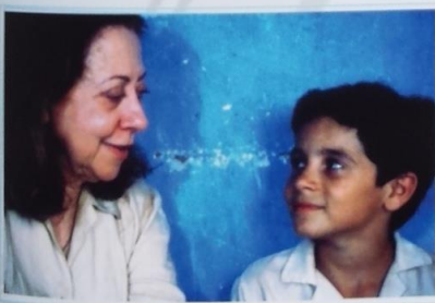
▲ Central do Brasil , 1998, Jacques Morelenbaum i Antonio Pinto Rozgrywająca się w Brazylii opowieść to dzieje przyjaźni kobiety w średnim wieku z chłopcem. Wyróżniona nagrodami muzyka jest pełna emocji, podobnie jak fabuła, i wzrusza publiczność do łez.