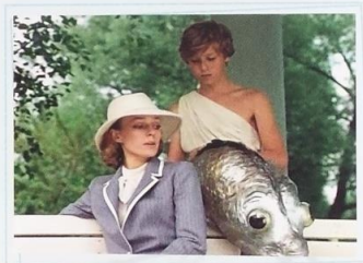
▲ Mary Poppins, do widzenia , 1983, Maksym Dunajewski Radziecki dwuczęściowy muzyczny miniseriał telewizyjny odwołuje się do sławnego filmu Disneya z 1964 r. z Julie Andrews w roli tajemniczej latającej niani. W warstwie muzycznej nawiązuje do muzyki filmowej z lat 70. i 80. XX w.