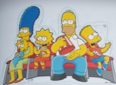
▲ Temat z filmu Simpsonowie , 1989, Danny Elfman Muzyka do popularnego filmu telewizyjnego zawiera reminiscencje w stylu retro z programów z lat 60. XX w. Różne aranżacje tego samego fragmentu towarzyszą komiksowej sekwencji początkowej.