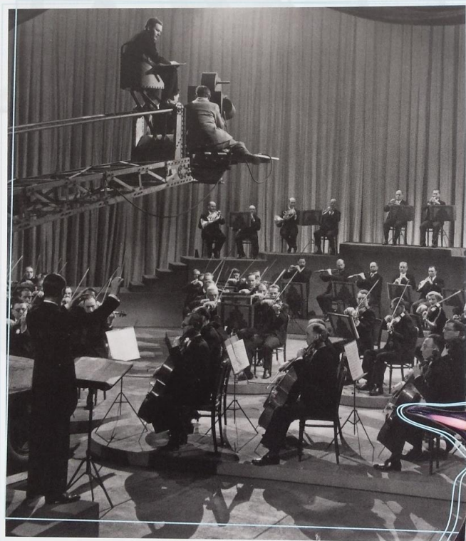
▲ Instrumenty orkiestry , 1946, Benjamin Britten

Od początków kina i telewizji muzyka stanowiła zasadniczy element czołówki i zakończenia filmów oraz programów. Muzyka towarzyszy także wydarzeniom fabuły, buduje nastroje , takie jak spokój lub napięcie. W reklamach chwytliwe dżingle tworzą skojarzenia i pomagają sprzedawać produkty. Kompozytorów wybiera się często na podstawie kryterium charakterystycznego stylu.