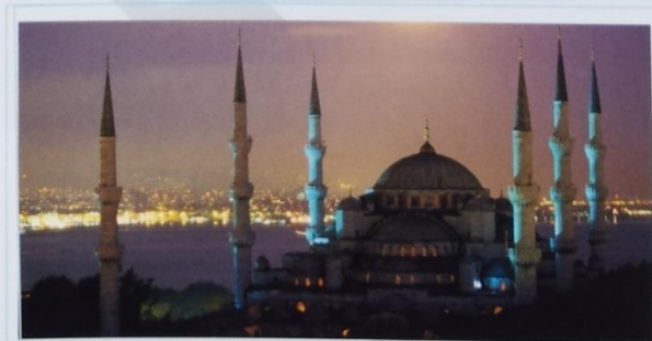
▲ Dżingle reklamowe kampanii turystycznej promocji Turcji , 2000–2002, Fahir Atakoglu Twórca muzyki do filmów fabularnych i dokumentalnych, turecki pianista i kompozytor Fahir Atakoglu, wykorzystał w dżinglach swój talent i umiejętności do przekazania za pomocą muzyki bezpośrednich treści.

Amerikanin John Williams skomponował muzykę do sześciu filmów cyklu. Znaczna część ścieżki muzycznej jest aktywna, utrzymana w szybkim tempie i pomaga budować dramaturgię opowieści. Muzyka Williamsa wyraża też i podkreśla emocje bohaterów.