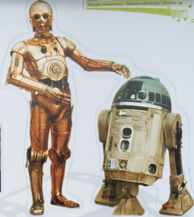
▲ Gwiezdne wojny , 1977–2005, John Williams

Amerikanin John Williams skomponował muzykę do sześciu filmów cyklu. Znaczna część ścieżki muzycznej jest aktywna, utrzymana w szybkim tempie i pomaga budować dramaturgię opowieści. Muzyka Williamsa wyraża też i podkreśla emocje bohaterów.